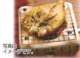
写真イメージです。